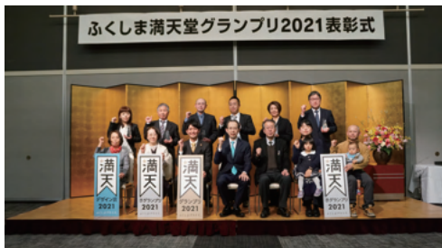
ふくしま満天堂グランプリ 2021 県内審査会・受賞式の様子