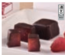
2023 準グランプリ賞 木苺の生キャラメルショコラ

コンセプトは「美しカラメル」。砂糖・全卵黄の自然糖質スイーツを糖ごと使い、ラズベリーキャラメルをチョココートし、アントルメのようにカットして、赤い宝石装飾ラズベリーを目玉で飾り美しく仕上げました。