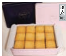
2023 グランプリ賞 ふくしまのお米を楽しむ食べ比べ米粉クッキー缶

福島産の美味しい米粉100%! お米の味がいっぱい楽しめる食べ比べ米粉クッキー缶です。滋味は出しがかり、ひとむね、天のふも、風味、粒の粉の添加物使用量が多い中あえて不使用で仕上げました。