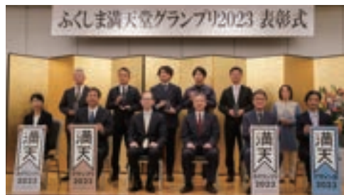
ふくしま満天堂グランプリ2023 県内審査会・受賞式の様子