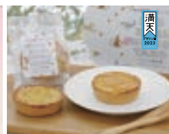
2023 デザイン賞 いもくり桃太郎 / IMOKURI MOMOTARO

福島産の産物糖質と大塚製菓のクッキーをブレンドした限定スイーツ「いもくり桃太郎」。一つ一つ丁寧に仕上げられた糖質、さつまいものやさしい甘さと味わいを深め、福島産の産物糖質を加えました。